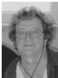
Lauterbach, im Juni 2022

In Liebe nehmen wir Abschied von unserer Mutti, Schwiegermutter, Oma, Uroma und Tante