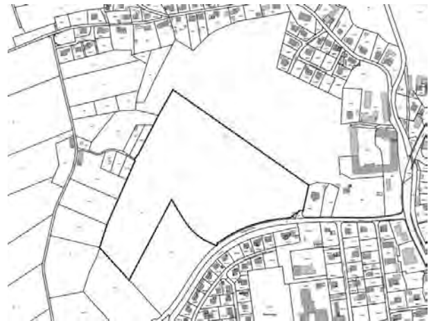
Abb.: Lageplan Geltungsbereich (nicht maßstäblich)

Fassung vom 01.06.2022 gebilligt sowie die Beteiligung der Öffentlichkeit und der Behörden mit sonstigen Träger öffentlicher Belange beschlossen. Der Bebauungsplan "Neues Sportzentrum Steingaden" wird im Parallelverfahren aufgestellt. Der räumliche Geltungsbereich der 15. Änderung des Flächennutzungsplanes umfasst Teilflächen der Fl. Nr. 1040 (Gemarkung Urspring) mit einer Größe von ca. 7,7 ha.