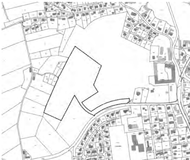
Abb.: Lageplan Geltungsbereich (nicht maßstäblich)

Die 15. Änderung des Flächennutzungsplanes wird im Parallelverfahren durchgeführt. Der räumliche Geltungsbereich des Bebauungsplanes umfasst Teilflächen der Fl. Nr. 1040 (Gemarkung Urspring) mit einer Größe von ca. 4,9 ha.